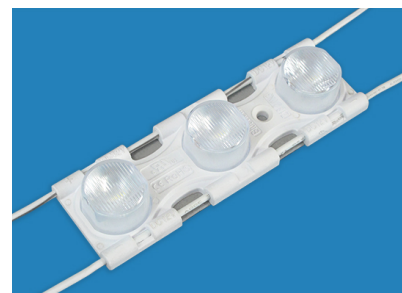
Led Power Side 3.8W SMD3030