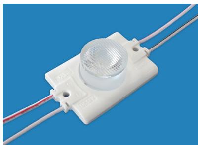
Led Power Side 2.5W SMD3535