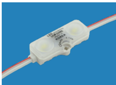
Led Sonic Samsung 2 LEDs