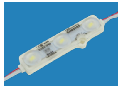
Led Sonic Samsung 3 LEDs