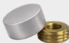
SCH - Satin Chrome