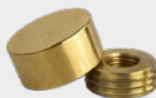
PGD - Polished Gold