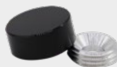
BLK - Black