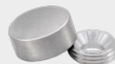
ST - Satin

A cápsula metálica foi concebida para montar espelhos, vidros, sinalização ou outros materiais, diretamente numa superfície, sem a necessidade de um distanciador.