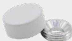
WH - White