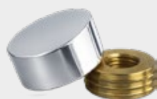
PHC - Polished Chrome