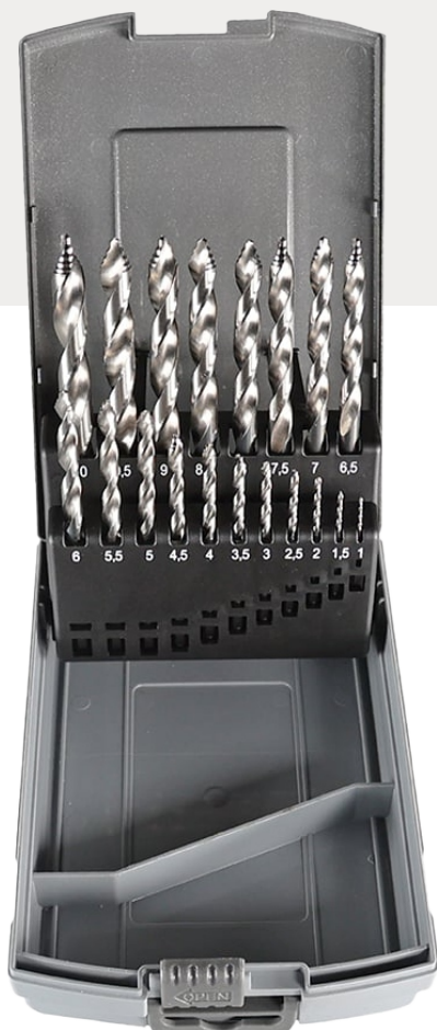
YelloMulti Drill Box