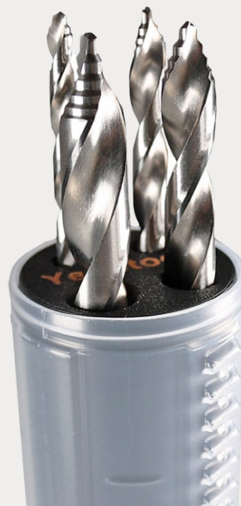
YelloMulti Drill 4

Conjunto de brocas helicoidais, ideal para materiais habitualmente utilizados em trabalhos publicitários, permitindo furos precisos e praticamente sem rebarbas. A sua geometria especial em degraus não só permite a autocentragem, como também elimina a necessidade de pré-furação e ainda reduz o desgaste.