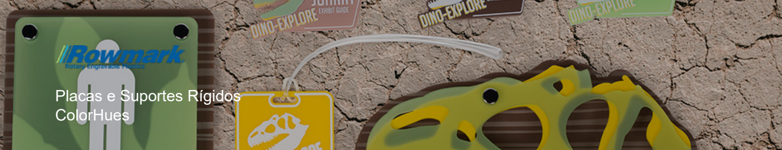
Placas e Suportes Rígidos ColorHues