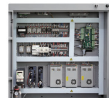
Construção industrializada garante longevidade e fiabilidade.