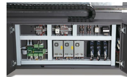
Construção industrializada garante longevidade e fiabilidade.