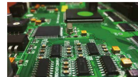
Sistemas de controlo inteligente e placas PCB com tecnologia própria.