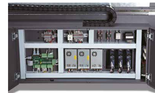
Construção industrializada garante longevidade e fiabilidade.