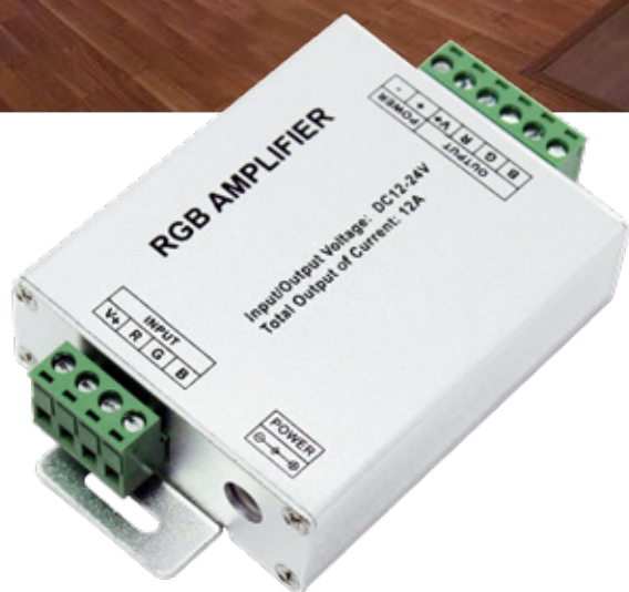
Amplificador Sinal JA-2 para Controlador LED JINBO 12v 24v

Amplificador de sinal para controlador de LED's RGB.