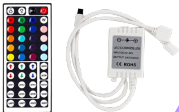
Controlador LED JINBO Infravermelhos 12v 24v IR-S-44