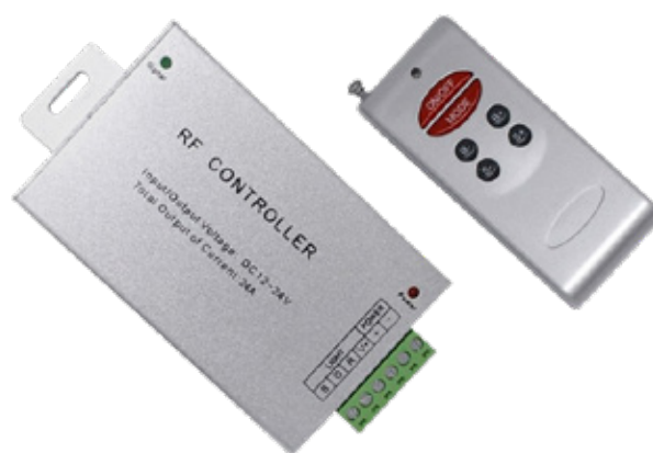
Controlador LED JINBO Rádio Frequência 12v 24v RF-N-6