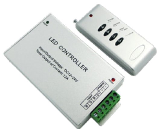
Controlador LED JINBO Rádio Frequência 12v 24v RF-N-4