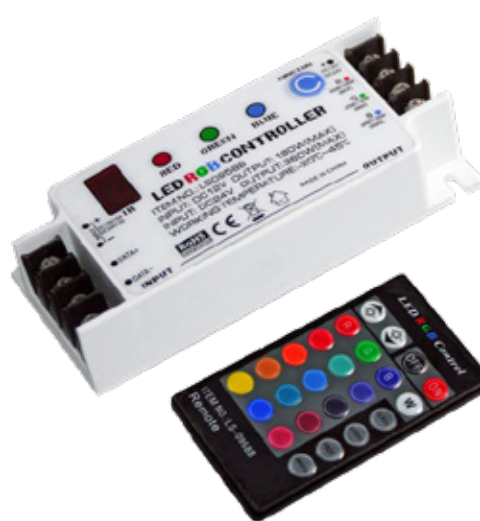
Controlador LED JINBO Infravermelhos Funções Syncro