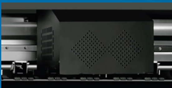
3 cabeças Epson i3200