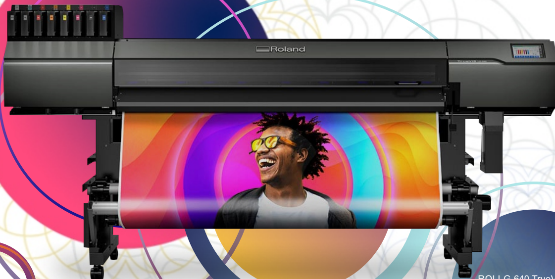
ROLLG-640 TrueVIS LG