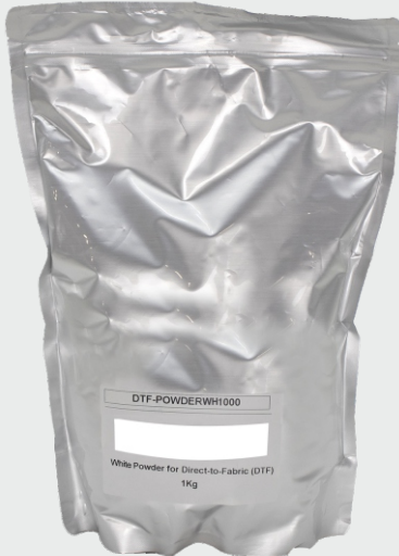
White Powder (pó branco)

Para mais informações e dados técnicos consulte o site www.dimatur.pt