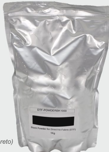
Black Powder (pó preto)