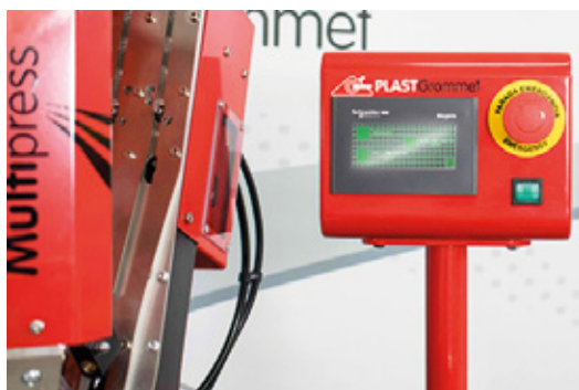
Painel de controlo para facilitar o seu trabalho