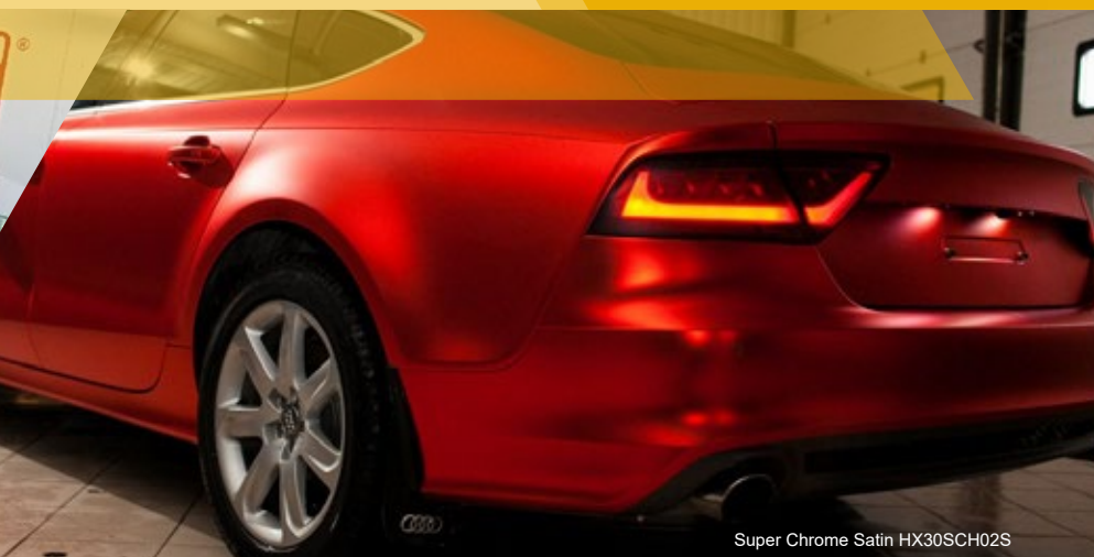
Super Chrome Satin HX30SCH02S