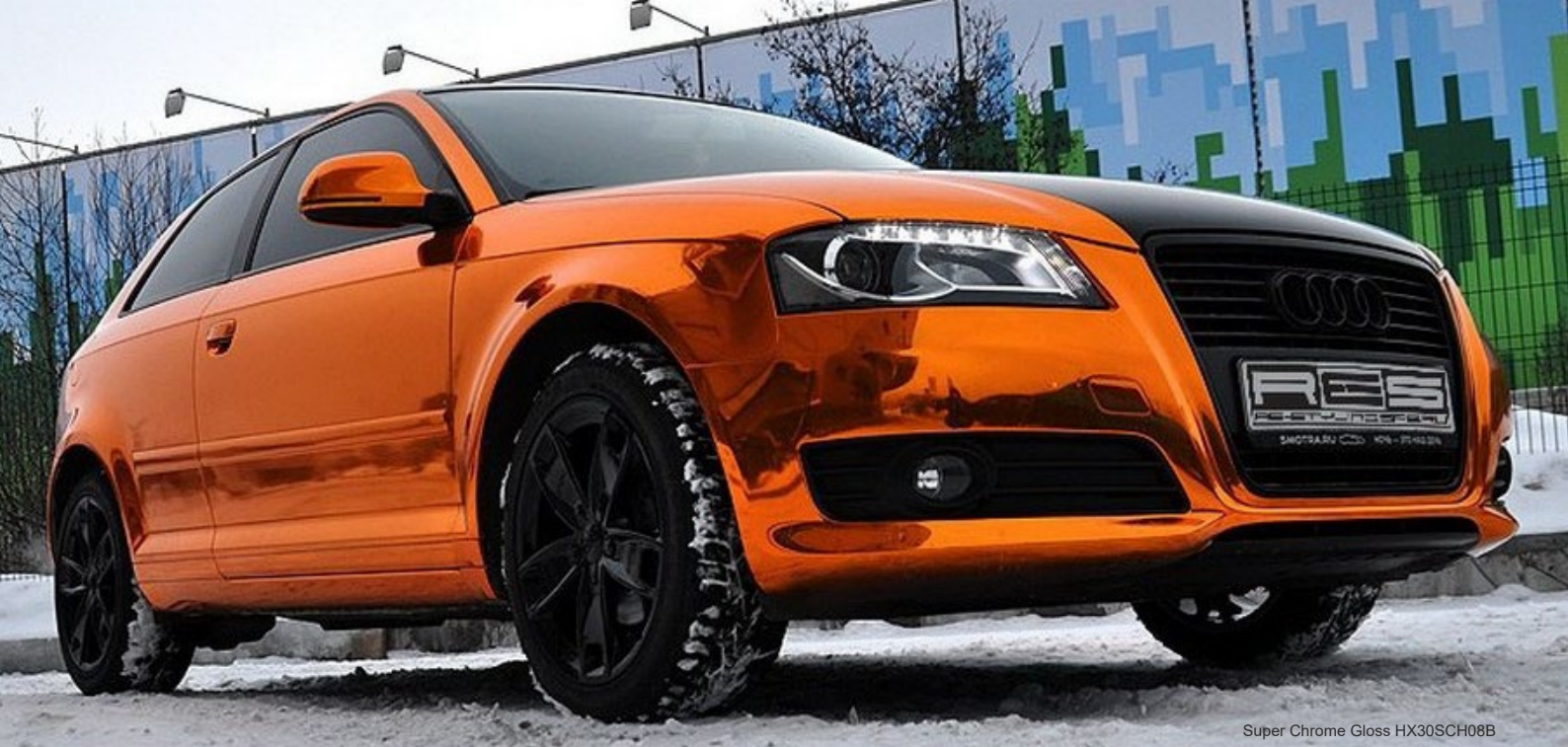
Super Chrome Gloss HX30SCH08B