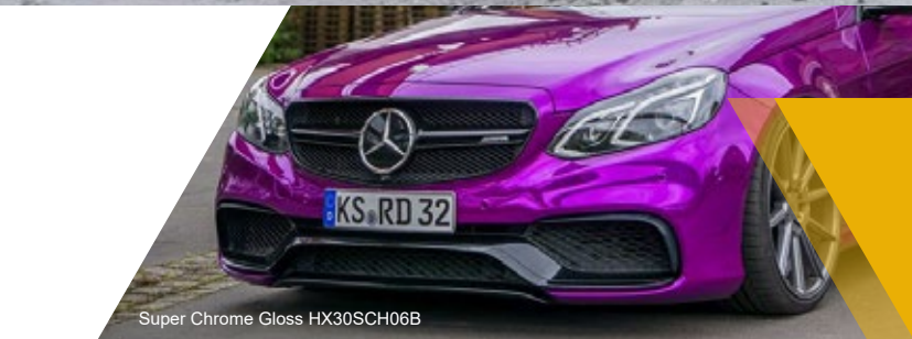
Super Chrome Gloss HX30SCH06B