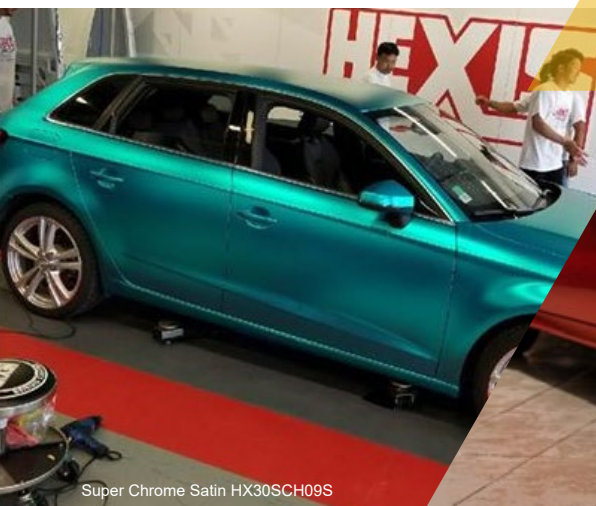
Super Chrome Satin HX30SCH09S

Para mais informações e dados técnicos consulte o site www.dimatur.pt