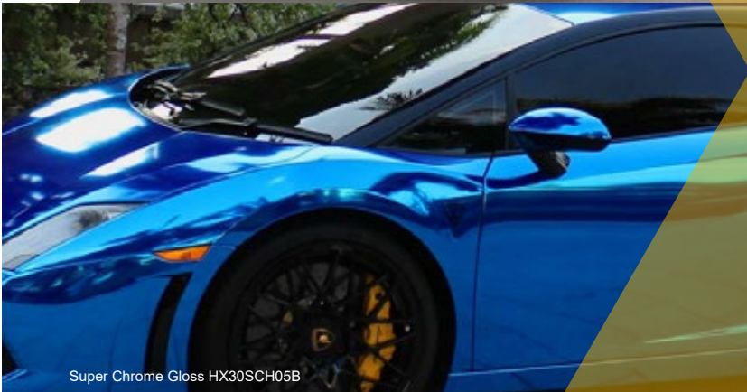
Super Chrome Gloss HX30SCH05B