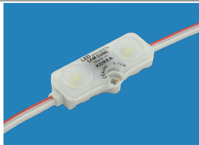
Led Sonic Samsung 2 LEDs