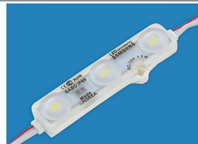
Led Sonic Samsung 2 LEDs