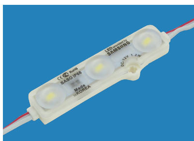
Led Sonic Samsung 3 LEDs