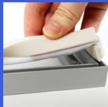
Facilidade de remover/rêpor