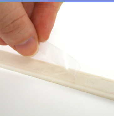
Retirar o liner

Para mais informações e dados técnicos consulte o site www.dimatur.pt