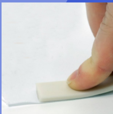
Colar sobre o tecido