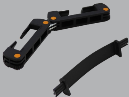
Kit conector ângulo de ligação para Expositor Roll UP S4 (vendido separadamente)

Kit de acessórios, para união de dois ou mais expositores, transformando-os num expositor de plano variável. A instalação é fácil e prática.