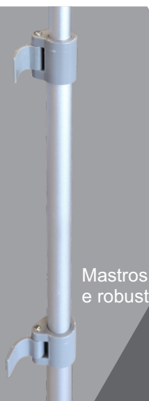
Mastros ajustáveis e robustos

Dois mastros de alumínio que se enroscam nos pés estabilizadores. Fixação do poster por entalamento no topo.